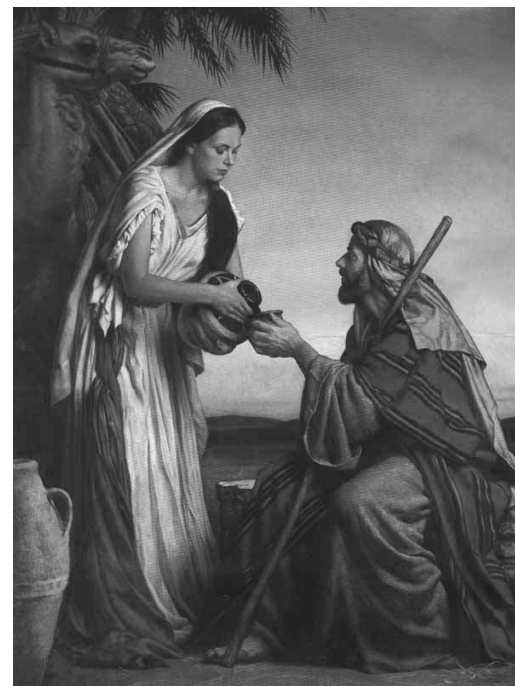
Rebeka s Abrahámovým sluhom Eliezerom pri studni

Keď Eliezer došiel do krajiny, odkiaľ jeho pán Abrahám pochádzal, zastavil sa pri studni, kde stretol Rebeku. (Je zaujímavé, že v dejinách spásy sa mnohé veľké veci udiali práve pri studni.) Stalo sa to takto: sluha pri studni stretol dievča, ktoré poprosil: „ Daj mi, prosím, odpiť trochu vody zo svojho džbána. “