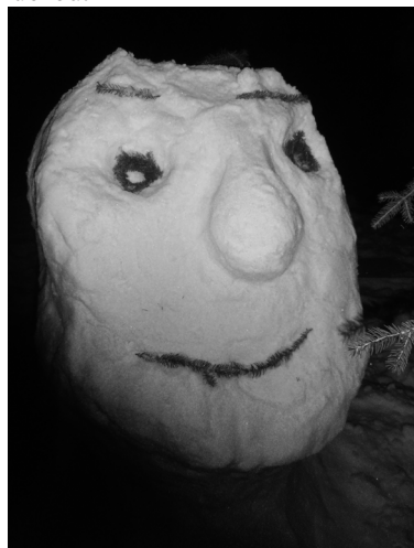
s birmovancami na Štrbe

V januári sme uskutočnili obhliadkovú trasu po ubytovacích zariadeniach v Tatrách. Videli sme štyri zariadenia, z ktorých sme dve vybrali na plánované podujatia s deťmi a mládežou.