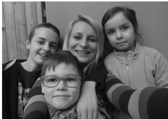
jarné prázdniny v Centre

Začiatkom leta od 27. 6. – 2. 7. 2015 organizujeme 6-dňový zájazd na sever Talianska. Uvoľnilo sa nám 5 miest, ak by mal ešte niekto záujem, môže sa prihlásiť v Centre.